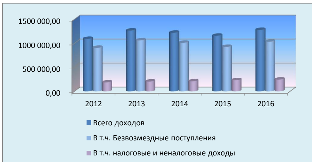
Динамика поступления доходов в консолидированный бюджет Рыбинского муниципального района

Рост налоговых и неналоговых доходов консолидированного бюджета Рыбинского муниципального района в 2013-2016 г. г. связан с увеличением налоговой базы по НДФЛ и земельному налогу. Налоговые и неналоговые доходы бюджета по сравнению с 2015 годом выросли на 6% и составили 246,2 млн. руб.